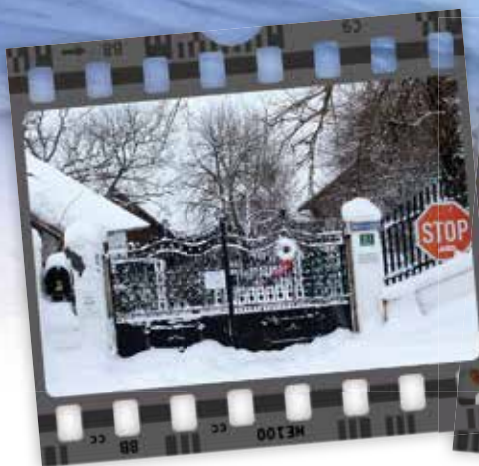
Winter im Tierparadies.