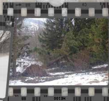
Auch im Rehwald sind Bäume umgestürzt. Glück im Unglück: es wurde niemand verletzt.

reith ein behördlich bewilligtes, öffentliches Tierheim ist, gibt es vom Land Oberösterreich nur ganz geringe Zuwendungen im Rahmen der gesetzlichen Minimalverpflichtung, wobei der Aufwand dafür um ein Vielfaches höher ist, als die Zuwendungen.