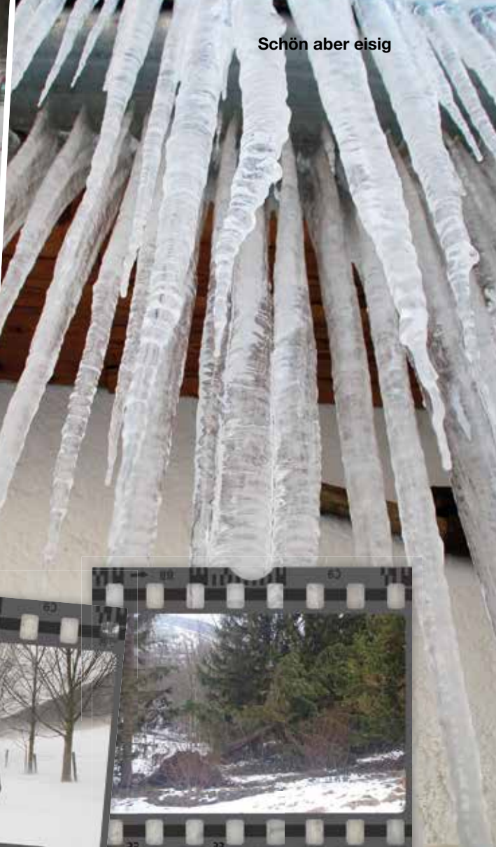
Schön aber eisig