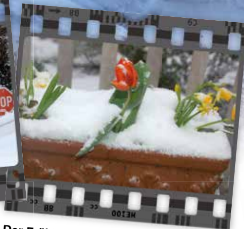
Der Frühling kämpft mit dem Winter und hat sich mittlerweile durchgesetzt.

gewohnt sind. Doch auch diese Seite möchte aufgezeigt werden, damit Sie eine Vorstellung bekommen, wovon ich hier schreibe. Mittlerweile ist der Frühling auch im Tierparadies angelangt und nur mit Ihrer Hilfe kann es zum Wohle der Schützlinge weitergehen.