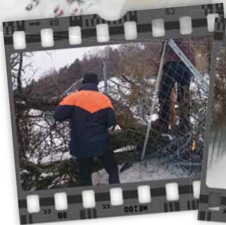
Der Sturm brachte einige Bäume zu Fall.