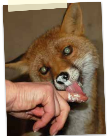
HERR MEIER VON SCHLAU

fen am Leben zu bleiben. Auch da kam unsere Tierärztin täglich und gemeinsam hatten wir Erfolg. Dass Du in dieser Zeit in das Baumhaus gezogen bist, damit ich in der Höhle mehr Platz habe, war total rück- sichtlich und sehr, sehr nett von Dir. Zu dritt hatten wir noch einige unbeschwerte Jahre und viel Spaß.