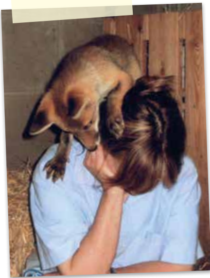
HERR MEIER VON SCHLAU

... seit fast zehn Jahren bist Du nun bei uns. Einige Wochen nachdem HERR MEIER VON SCHLAU bei uns eingezogen ist, haben wir Dich mit vielen Tricks aus einer sehr aussichtslosen Lage befreit. Kannst Du Dich noch an den Hasenkäfig erinnern in dem Du sitzen musstest?