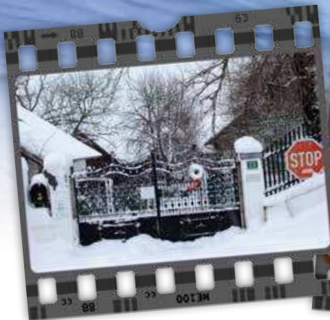
Winter im Tierparadies.