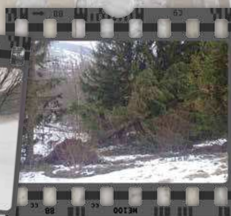
Auch im Rehwald sind Bäume umgestürzt. Glück im Unglück: es wurde niemand verletzt.

reith ein behördlich bewilligtes, öffentliches Tierheim ist, gibt es vom Land Oberösterreich nur ganz geringe Zuwendungen im Rahmen der gesetzlichen Minimalverpflichtung, wobei der Aufwand dafür um ein Vielfaches höher ist, als die Zuwendungen.