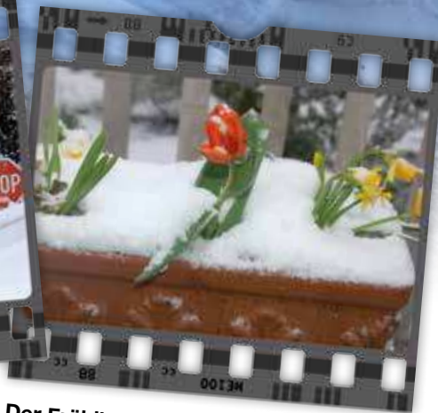
Der Frühling kämpft mit dem Winter und hat sich mittlerweile durchgesetzt.

gewohnt sind. Doch auch diese Seite möchte aufgezeigt werden, damit Sie eine Vorstellung bekommen, wovon ich hier schreibe. Mittlerweile ist der Frühling auch im Tierparadies angelangt und nur mit Ihrer Hilfe kann es zum Wohle der Schützlinge weitergehen.