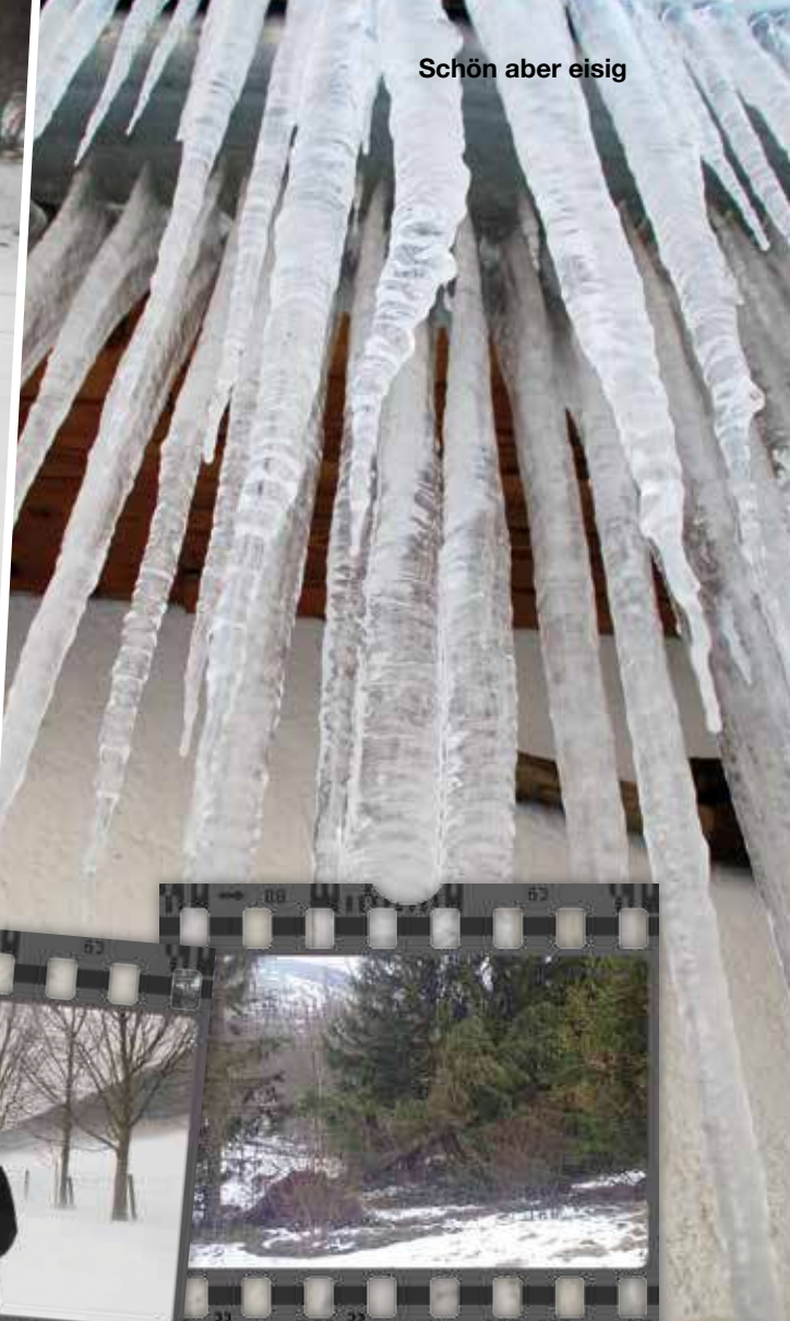
Schön aber eisig