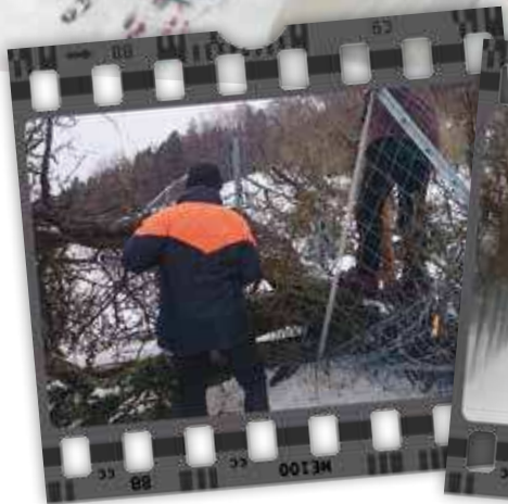
Der Sturm brachte einige Bäume zu Fall.