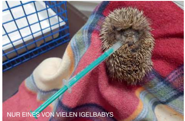
NUR EINES VON VIELEN IGELBABYS